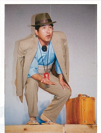
司会・総合プロデュース 間 六口