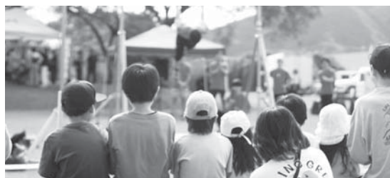
<たのしまんとリバーフェスティバル>

私たちと共に活動してみたい！という方は、当会議所事務局までご連絡をお願いします。