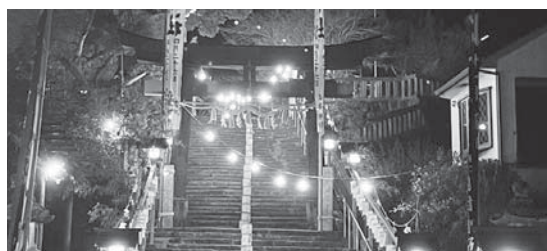
<一條大祭御神火提灯行列>