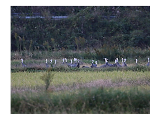
車が接近し、警戒する群れ