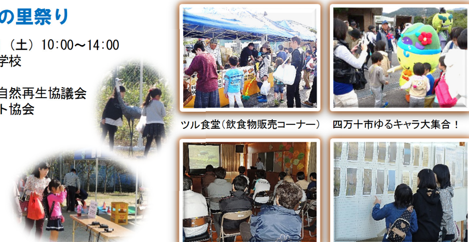
ツルのデコイを双眼鏡で見よう!

【実施内容】地元の方から「今年はいつやるが?」と聞かれるほどに、地域に親しまれるお祭りとなりました。参加者は、学び、味わい、楽しみながら「ツルの里づくり」に親しみました。