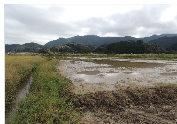
ねぐらとするために水を張った水田(江ノ村箇所)

【実施内容】セブン-イレブン記念財団の助成金で江ノ村箇所の休耕地を借り上げ、地元農家の方に米を作ってもらい、収穫後にツル類のえさとなる二番穂を残しました。また、ツル類は水深の浅い水域をねぐらとするため、渡来期にえさ場に隣接する田に水を張りました。国土交通省が中筋川の中山箇所と間箇所に整備した人工湿地では、6月に田植機等でイネの苗を植えました。