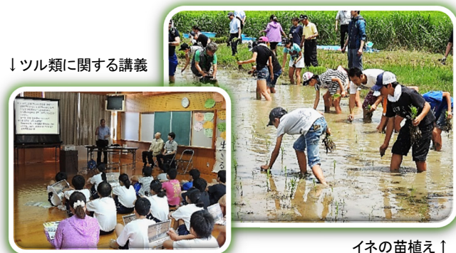
↓ツル類に関する講義

【実施内容】当会がツル類の生態や四万十市での行動について説明し、国土交通省から「四万十川自然再生事業(ツルの里づくり)」について紹介してもらいました。その後、子どもたちは、秋にツル類のえさとなることを願って、中山箇所の湿地にイネの苗を植えました。