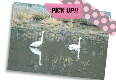
当では珍しいコハクチョウが中山箇所です約3週間過ごしました。